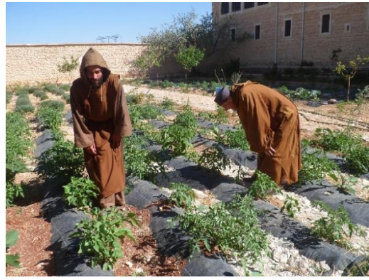
Tomaten in kleine binnentuin dit boompje in de kleine binnenkoer!