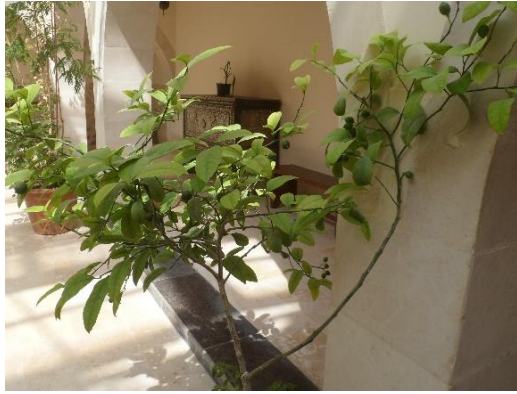
Minstens 40 citroenen (nu nog) aan