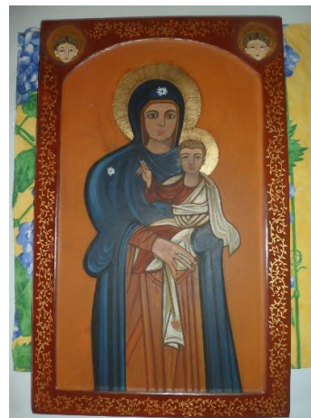
Bestelde iconen worden afgewerkt