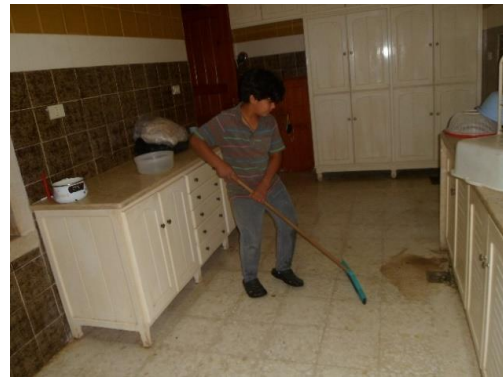
Dagelijks de keuken poetsen