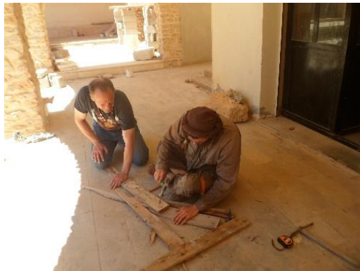
Planken recupereren van kapotte paletten