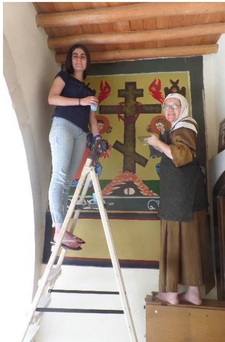
Thee pauze bij de verdere afwerking van deze icoon aan de ingang van de kerk