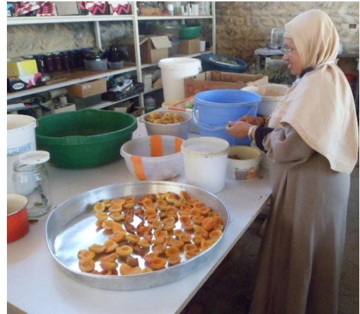
Abrikozen drogen op het dak