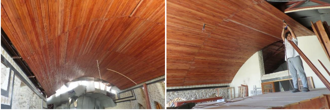
2/3 van het plafond van de nieuwbouw is afgewerkt.