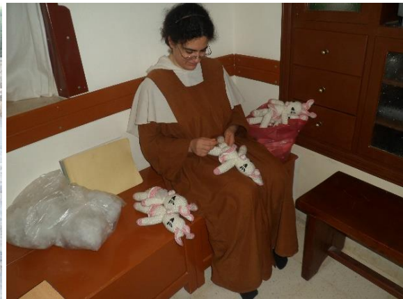
Zr Myri zorgt voor de (in Europa) erg gegeerde poppen