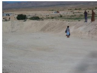
Een nieuwe vijver voor het kweken van vissen op het terrein (50 op 20 m).