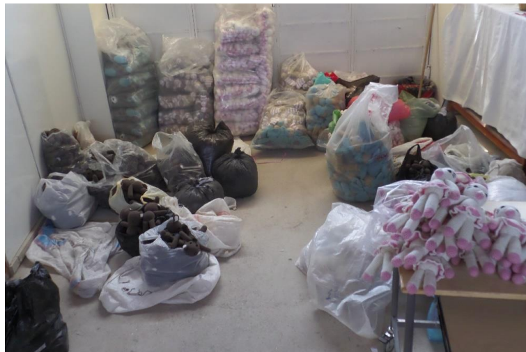
300 X 4 verschillende soorten = 1200 bestelde poppen. Dit is bijna de helft.