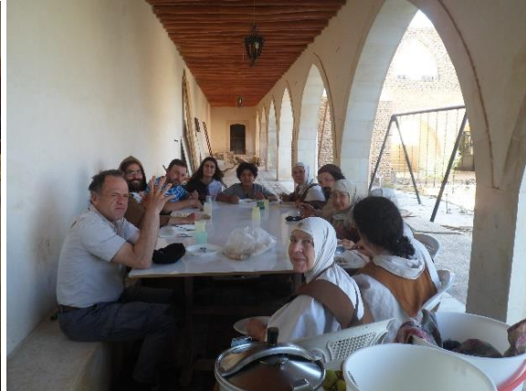
O.L.V. Tenhemelopneming: opdracht van onze voornemens. Middagmaal in de tuin.